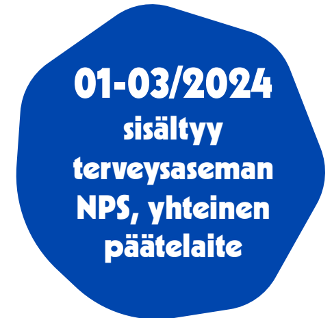
Suun terveyden huollon yksikkö