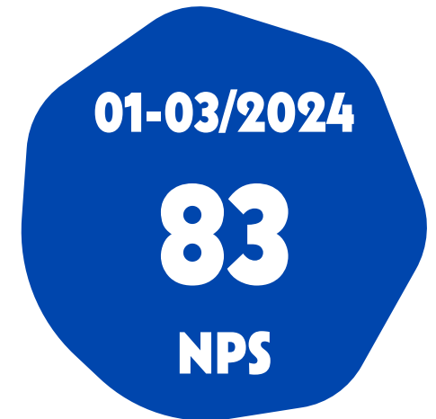
Suun terveyden huollon yksikkö